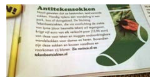
Max Magazine week 12

Naast het uitzenden van de commercial Hondje, liepen er twee acties op onze website c.q. via social media: de sokkenactie van Rovince (20% korting op een paar sokken PLUS € 5,- naar de stichting voor elk verkocht paar sokken) en een petjesactie, waarmee kinderen een petje konden winnen. Ook werden persberichten verstuurd en werden (online) enkele artikelen geplaatst over teken in de eigen achtertuin .