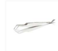
TickEase, de 2-in-1 tekenverwijderaar voor mens en dier