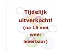
Loepje (vergroot 10x) uitschuifbaar met sleutelhanger - binnenkort weer leverbaar!