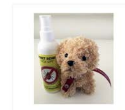
AANBIEDING: combi Insect Schild + hondje