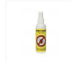
Sentz Insect Schild - tekenspray