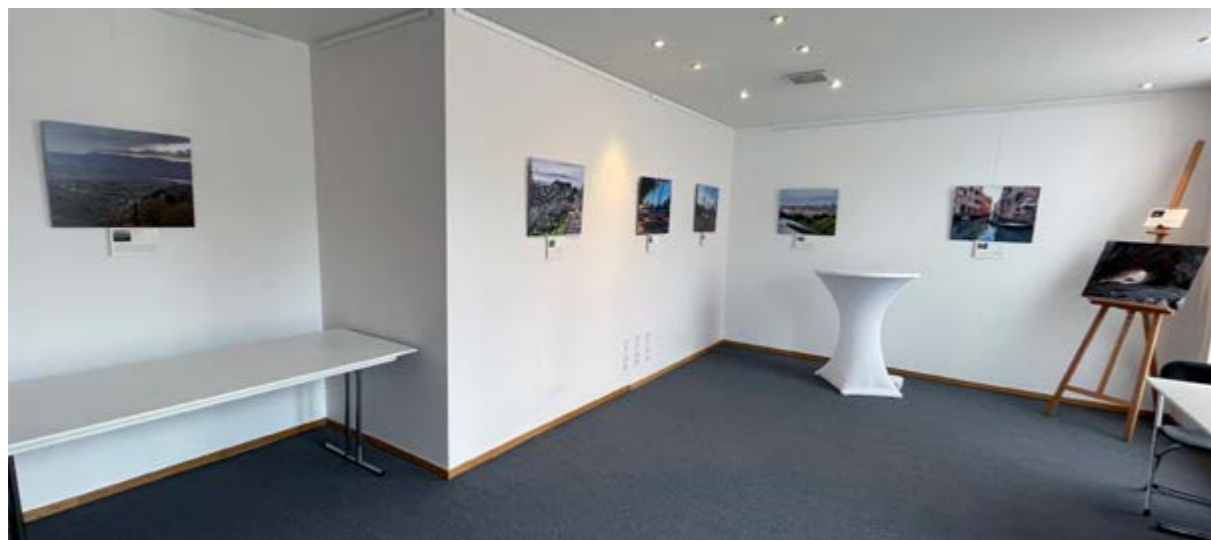
Boven: een deel van de expositieruimte.